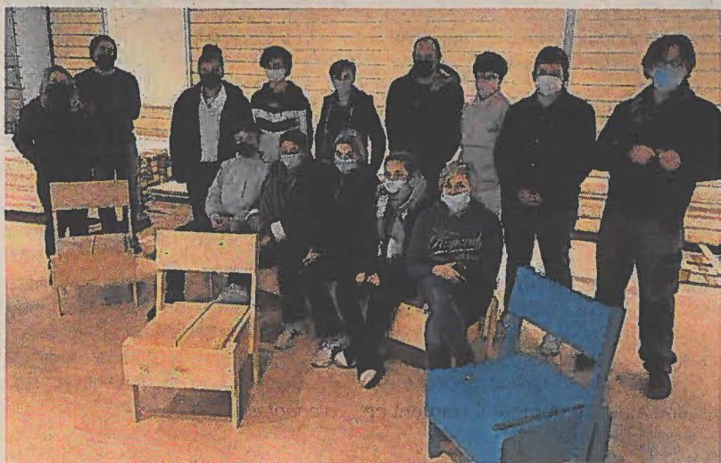
Tables, chaises, et structures en bois, fabriquées par des jeunes Briochins, équiperont l'intérieur du nouvel espace jeunes.