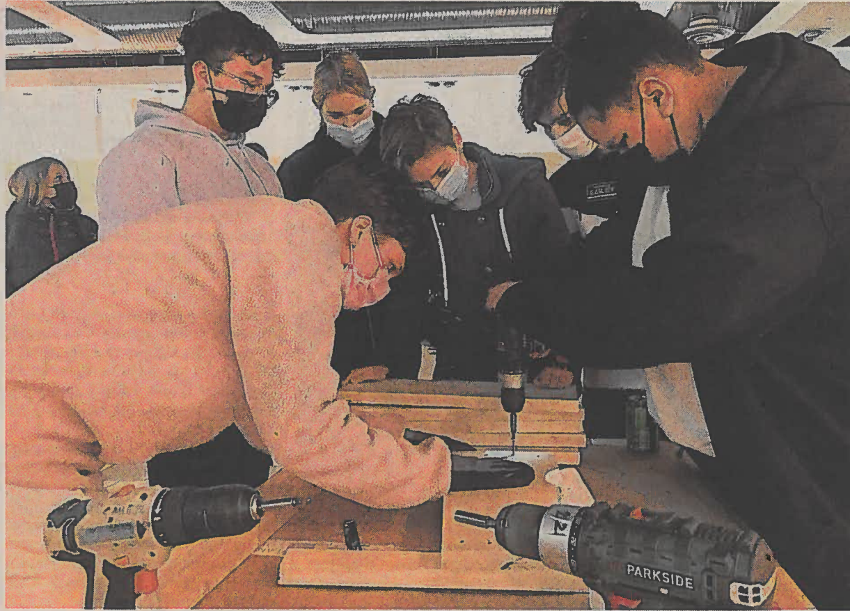
Les jeunes Briochins sont impliqués dans la création du nouvel espace jeunes municipal. Un chantier participatif est organisé pendant deux semaines, en amont de l'ouverture du lieu mercredi 9 mars 2022.

La conception du lieu est orchestrée par le Conseil d'architecture, d'urbanisme et de l'environnement (CAUE). Pendant deux semaines, l'organisme départemental et ses architectes, paysagistes et designers animent des ateliers participatifs pour aménager le local. « Nous avons souhaité